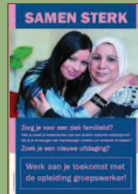
Foto: De in Nijmegen gebruikte wervingsfolder

De cursus voor producenten was nuttig, want het blijft moeilijk om te snappen: wat is nou precies het doel? Omdat het verschillende doelen heeft. Voordat je er genoeg in thuis bent om lokaal je eigen partijen er over te kunnen informeren, heb je tijd nodig en daar waren die dagen voor de producenten heel zinvol voor. En natuurlijk om elkaar te stimuleren en te enthousiasmeren.