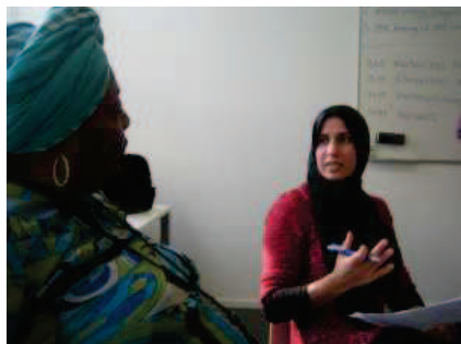
AMWAHT in opleiding