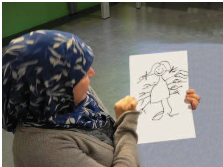
Mantelzorgers zijn duizendpoten

met de stage-instellingen, heeft BMP een cursus van vier dagdelen ontwikkeld. Daarnaast is een cursus van acht dagdelen voor docenten ontwikkeld waarin zij zich het curriculum eigen maken, zich verdiepen in de problematiek van allochtone mantelzorgers en de regelingen en instanties waar zij mee te maken hebben. Om producenten en docenten tijdens de voorbereiding en uitvoering van de opleiding met raad en daad bij te kunnen staan is een kleine backoffice ingericht die bemand wordt door medewerkers van BMP die ervaring hebben met het AMWAHT-traject. Deze medewerkers zijn telefonisch te benaderen, maar kunnen ook mee-gaan bij belangrijke besprekingen met bijvoorbeeld een financier.