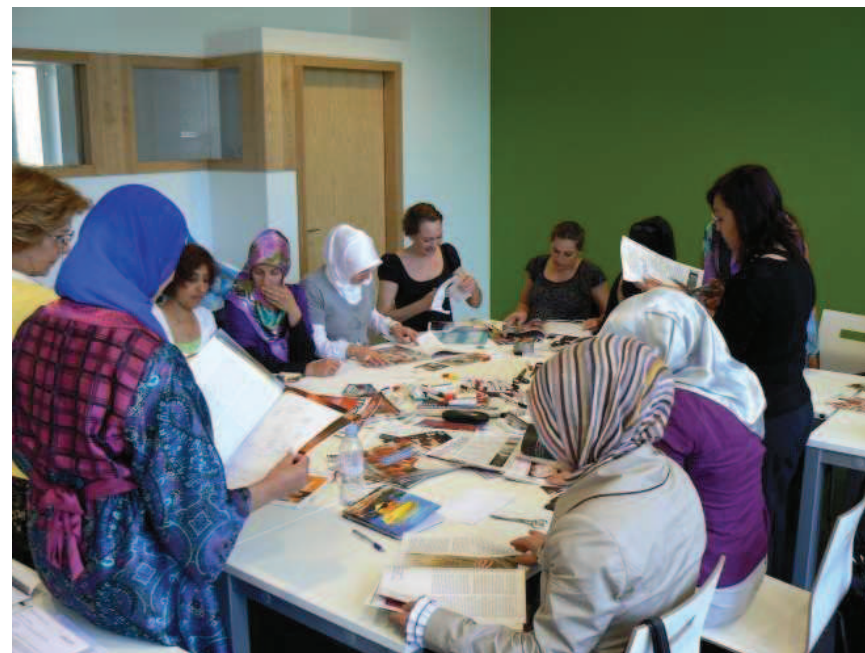
AMWAHT opleiding in Amsterdam

taak, of weet ik wat? Wat ik dan in de lotgenotengroep merkte, dat er mensen waren die ook vroegen hoe het met mij ging. Kunnen jullie inschatten wat dat voor mij betekende? Heel veel, echt heel veel. Dus ik was wel belangrijk. Ik ben ook sterk, ik heb ook kracht, en ik heb ook gevoelens. Dus ik ben ook een mens.”